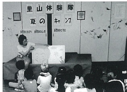
里山体験隊 2015 夏のキャンプでのおはなし会