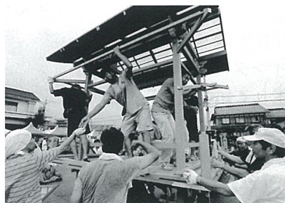
夏祭り用の櫓(やぐら)を組む様子

じです。でも、課題は盛りだくさん。みなさんの小さな協力の積み重ねによって、いつか開催できる日が来る」と将来の再開にも期待を寄せていました。