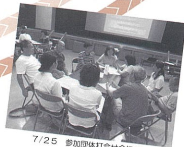
7/25 参加団体打合せ会にて

11月11日（土）はご家族、お友達、ご近所、みんなでご誘いあわせて、たかしま市民活動フェスタ2017へぜひお越しください！