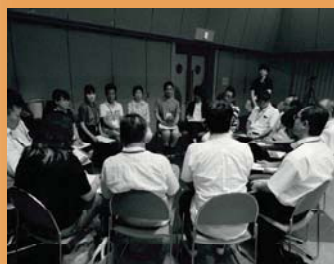
メンバーで意見を出し合います