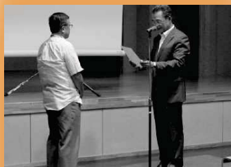
市長から委嘱状をいただきました