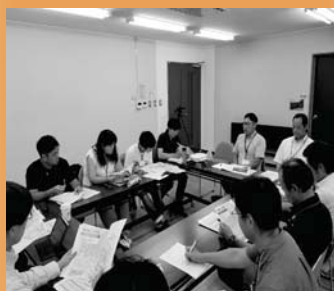
グループ会議も開催されました

2021年3月まで、市長から委嘱を受けた委員15名が、持続可能な高島市の将来社会に向けて、現在の地域課題を把握するために行政の取り組みや市民の取り組みについて調査やヒアリングを行い、現状やニーズを把握した上で、市民の視点から市民、行政、事業者の取り組みについて検討していきます。