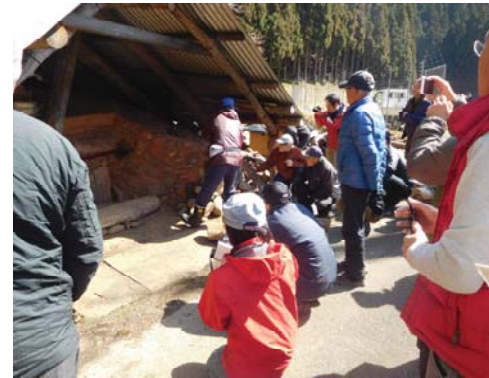
朽木・雲洞谷で完成した炭がま (2019年3月)

たかしま市民協働交流センターと市内の森林に関わる組織や団体がすすめている「たかしまの森へ行こう!プロジェクト」では、高島市内の炭焼きグループと炭に関心を持つ方々との「炭焼き交流会」を開催します。