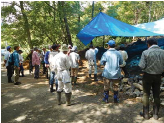
森林公園くつきの森で炭がまの設営を開始 (2019年9月)

滋賀県の中でも有数の木炭生産地だった高島の山々。里山のナラやクヌギの木を一定の高さで切り、再生を繰り返す「ひこばえ」の部分で炭作りに用いる暮らしがありました。木を炭がまで焼いて炭を作り、できた炭を家庭で使う暮らしは、森林と人々の暮らしの間で資源が循環する持続可能な仕組みでした。