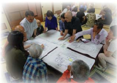
今津町の中浜区・北浜区では、毎年6月に合同の避難所運営体験を実施しています。

シニア世代、子育て世代、若者、中高生など、あらゆる世代の女性も男性も、まちづくりに「参加する力」を呼びおこすヒントを見つけに来てください！