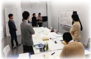
高島市に関するさまざまな文献を調べて、バスに関する情報を洗い出し、整理しました。