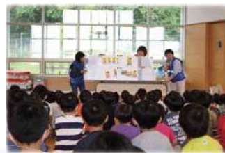
避難の基本「おはしも」を 紙芝居とクイズで伝えます。