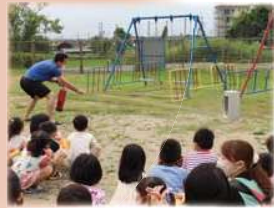
園の先生方による消火器の 操作体験を実施しました。