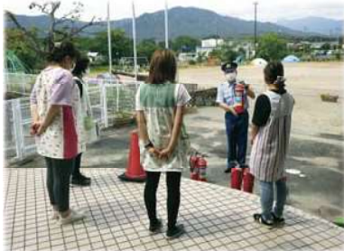
子どもたちの体験の間、先生方は集中して消防職員から災害時の活動について指導を受けることができます。