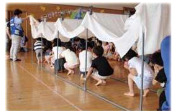
「煙が出ている時はどうやって逃げますか？」