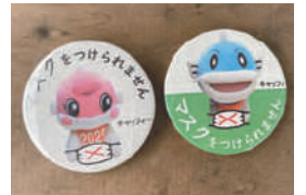
滋賀県「マスクをつけられません」バッジ

大人も子どもも、マスクをつけ続けることが困難な人は無理をしなくて良いことをご存知ですか？ 長引く感染対策に気をすり減らす日々ですが、 「何か事情があるのかな。」という互いを思いやる気持ちも忘れずに。