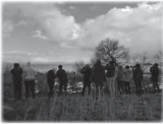
寒い冬でも、水鳥たちには熱い視線が送られます。

共催で10年以上継続されており、貴重な記録が蓄積されています。小学生から参加でき、山、里、湖岸を6キロほど歩きながら確認した野鳥を記録していきます。夏、5000羽ものツバメがヨシ原に集まる「ねぐら入り」の観察は迫力満点。冬はコハクチョウの観察が人気です。シジユウ