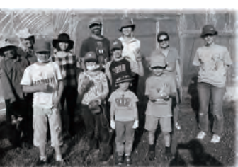
みんなで楽しく、国際交流! 海外からの参加者は、Workaway (ワーカウェイ) というサービスを利用して来られるそうです。 https://www.workaway.info/