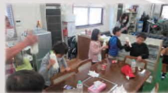
子どもたちで実験タイム！ さあ、どうなるかな？

ホッと一息つきながらお話しできる機会を つくり、第4土曜日は子どもたちを対象に、 みんなでお昼を食べて遊べる子ども食堂を 開店。そして第4日曜日の午前9時からの 会館清掃日は、掃除後の一服タイムを楽し みに住民がボランティアで集まるそうです。ほ かにも、区と連携して夏祭りや秋祭りを開催す るなど、息の長い活動をめざしておられます。