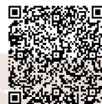
QRコードを読み取ると冊子 の内容をご覧ください

地域の中の居場所やサロン、ボランティアグループ、出張・配達の実施している店舗や事業者の情報など、暮らしを支える情報が満載です。この冊子は、市内の公民館、医療機関などでお読みいただけます。個人で入手したい場合は、高島市のホームページからPDFファイルをダウンロードしていただくか、たかしま市民協働交流センターまでお問い合わせください。