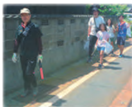
ゴミ拾いをしながら ウォーキングを