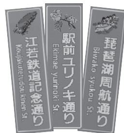
こんな看板ができました！

地域で活躍する団体同士のつながりを作り、連携で活力ある今津地域をめざしておられます。通りのネーミング事業では看板イラストを高島高校美術部に依頼。「琵琶湖周航通り」、「駅前ユリノキ通り」、「江若鉄道記念通り」のイラスト入り看板が設置されました。中学校との連携では、絵とひらがな表示の誰でも理解できるゴミ出し案内を作成。地域の声を形にしておられます。2024年から5年間のまちづくり計画を作るために、30〜60代の地域も関心もさまざまな17名が取組んでおられます。今津の魅力を活かしたまちづくりを話し合い、その経過を広報誌「つながろう今津」でお知らせされますので、ご意見をお寄せください。「まちづくりよろず相談」は、土曜日午後1時半から開きます。今津のまちづくりに関して、何でも相談していただけます。