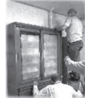
みんなで協力して作業します！

防災部会では広域避難所 ごとに区役員が避難所運営 について話し合う、打合せ 会議の開催を予定しておら れます。また、高齢者宅の家具転倒防止 器具の設置も継続されます。