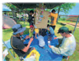
集めたゴミから… アート作品誕生！

2025年、滋賀県で開催される「わた SHIGA 輝 く国スポ・障スポ 2025 大会」に向けて、高島市