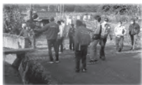
「地域探訪」を行いました