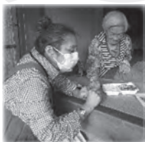
「元気にしてた〜？」 「いつもありがとうな」