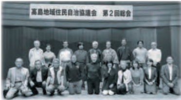
総会では地域の歴史をテーマにした朗読劇 を上演し、地域への理解を深めました