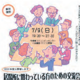
居場所に関わっている方のための交流会

たかしま市民協働交流センターでは、地域のサロン、子ども食堂など、高島市内でさまざまな「居場所(通いの場)」の運営に関わっている方のための交流会を、今年度も継続して開催していきます。