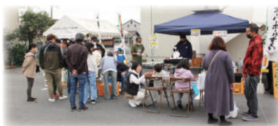
懐かしい子ども遊びの体験を楽しんでいただきました