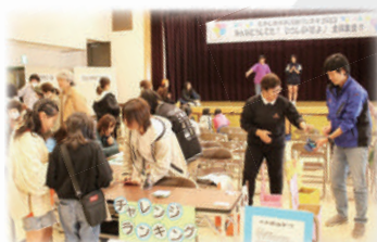
子どもたちのためのチャレンジ企画も

で合唱し、たくさんの笑顔が生まれました。この春から、実行委員会の皆さんが話し合ってテーマや構成を検討し、参加団体から自分たちの思いが伝わるさまざまなアイデアを企画を持ち寄っていただきました。そのおかげで実現した今回の市民活動フェスタには、多くの皆さんに訪れていただき楽しいひとときになりました。本当にありがとうございました。