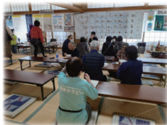
参加団体の活動内容を紹介

オープニングを飾っていただいたのは、「キッズジュニアダンスチームADGW」の皆さん。会場では、今年のテーマ「みんなどうしてた？ひさしぶりだよ♪全員集合！！」のとおり、市内各所、さまざまな分野で活動されている市民活動団体が一堂に会し、物販や飲食の提供、体験イベントなどを通じて、来場された皆さんとの再会を喜び合い、会場のあちこ