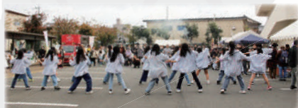
オープニングはキッズダンスで華やかに！