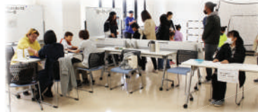
健康やスポーツの体験コーナーも

午後からは、ストリートピアノ体験会やステージ発表が始まり、～Lefa～(リーファ)のお二人によるコンサートへ。フィナーレでは「琵琶湖周航の歌」をみんな