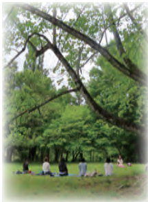
雨天の場合は、屋内で開催します