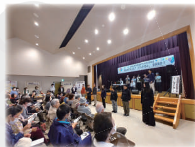
フィナーレは、リーファと、よし笛の会、手話サークルの皆さん、そして会場の皆さんで！！