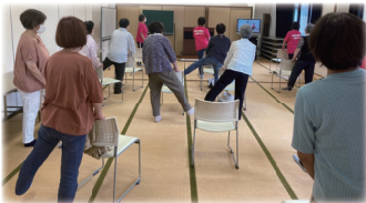
多彩な活動を通して助け合う まちづくりを目指しています

昨年実施した住民アンケートでは、除雪や買い物など暮らしの不安が出ており、今後は区と連携してできることを考えていく予定。「小さな関わりでも、一人ひとりが何か役割を持つことで、助け合うまちづくりができます。少しずつ仲間を増やし継続的な活動にしたいと思います」と語ってくれました。