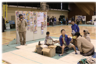
Re: フェスタかしまの会場のようす

再生可能エネルギーの活用は、二酸化炭素の排出を抑え、私たちの暮らしを快適にし、地域を活性化していきます。これからも、再生可能エネルギーや省エネルギーの効果を身近に感じていただけるよう、工夫しながら活動を続けていきます。