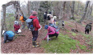
みんなで楽しくタネ拾い中。

山で集めた種から育てた木の苗を植えたいと、仲間とともに「タネカラプロジェクト」を設立し、種集めを始めました。