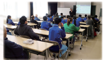
環境ワークショップには 中学生も参加しました

台風、干ばつ、豪雨、猛暑。毎年、世界各地で発生する自然災害は、大気中に含まれる二酸化炭素(CO 2 )をはじめとした温室効果ガスの増加が引き起こす地球温暖化が関わっています。私たちの生活を脅かす地球温暖化を抑制する対策として有効なのは、私たちの暮らしから排出される二酸化炭素を削減する「脱炭素」。世界や日本の各地で、市民活動だけではなく、さまざまな企業や組織が、脱炭素の機運を高め、持続可能な社会を実現するための取り組みを進めており、高島市でも「高島市地球温暖化対策実行計画(区域施策編)」の策定を進めています。