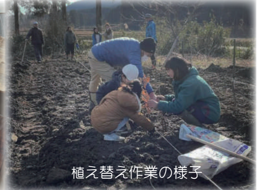
植え替え作業の様子