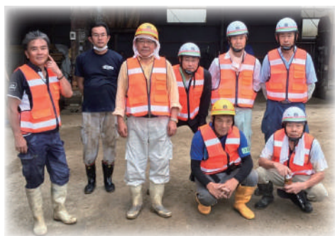
経験豊かな朽木災害ボランティア隊の皆さん。

メンバーの皆さんは長年、消防団や消防士として災害の対応や行方不明者捜索などの経験をされています。朽木支所や市社会福祉協議会からの依頼を受けて、市内で起きた土砂災害では、これまでの