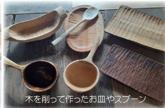
木を削って作ったお皿やスプーン