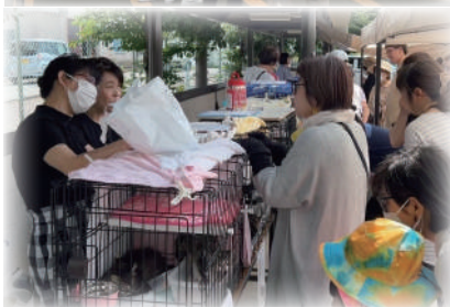
猫の譲渡会の様子です。