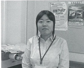
中大井津市 千尋さん